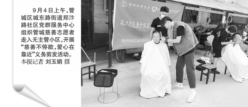
9月4日上午,管城区城东路街道郑汴路社区党群服务中心组织管城慈善志愿者走入无主管理小区,开展“慈善不停歇,爱心在靠近”义务理发活动。

家”,我帮墙壁“美容”…… 清洁家园忙得不亦乐乎,别的小组同样热火朝天——志愿者招募组在40个楼院设点招兵买马,仅两个小时就招募到数百名志愿者,他们有老年人,也有小学生,有上班族,也有自由职业者;文明家园倡导组进楼院人家家庭发放网络安全、金鸡百花电影节、人口普查等宣传资料万余份;“邻里家人”关爱组走进80户困难家庭送爱心菜和防疫口罩。 截至目前,南阳新村街道通过实施“志愿新村”战略已经在辖区第一批59个楼院培育了59支楼院志愿服务队伍,从街道机关到社区,再到辖区单位在册志愿者达到两万余人。此次千人“大会战”正是楼院志愿服务队第一次联动试水。