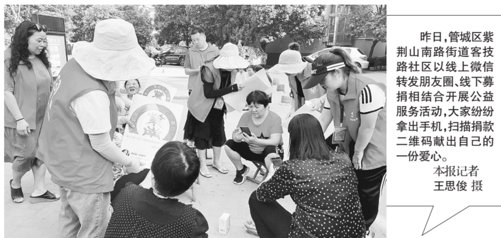
昨日,管城区紫荆山南路街道客技路社区以线上微信转发朋友圈、线下募捐相结合开展公益服务活动,大家纷纷拿出手机,扫描捐款二维码献出自己的一份爱心。

行金水”慈善救助项目,由郑州惠同明医疗器械销售有限公司向郑州慈善总会“精准扶贫 健康中原”慈善基金捐赠100万元,定向用于金水区困难群体眼病救治。 金水区以“中华慈善日”、“99公益日”和“郑州慈善日”为载体,以募捐救助为平台,以慈善项目为抓手,聚焦脱贫攻坚、聚焦特殊群体、聚焦群众关切,不断推动全区慈善事业新发展。