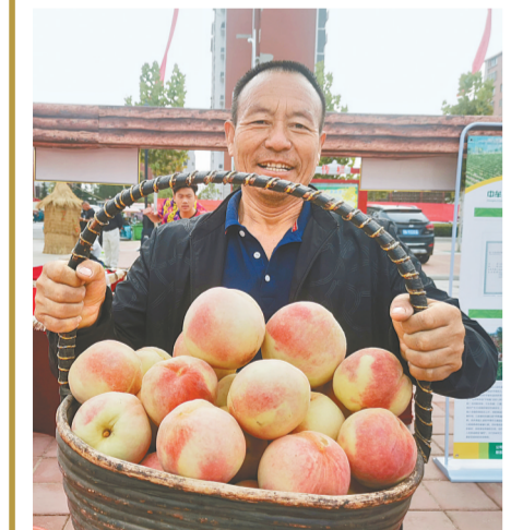
中牟特色农产品吸引众人目光

活动现场，中国邮政集团有限公司河南省荥阳市分公司和郑州市建业百货有限公司分别与农户签订国内快递包裹寄递服务合同和石榴购销合同，助力农业产业增产、增效和农民致富增收。