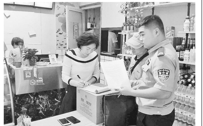
工作人员对沿街门店开展消防安全检查

本报讯(记者 覃岩峰 通讯员 张佳莉 文/图)为进一步营造平安文明的辖区环境,消除各类安全隐患,日前,祭城街道办事处心怡社区联合物业及辖区派出所对沿街门店开展消防安全检查工作。 检查中,工作人员逐户入店进行安全排查,主要对各个门店是否违法使用液化气罐;是否配备消防器材,消防器材是否完好有效;店内安全通道是否畅通;是否私拉乱接电路线路和电线老化等进行了全面检查。对于检查中发现的安全隐患进行一一登记,并对发现的问题当场提出整改意见。对无法现场整改的问题,当场下发告知书,并对整改情况进行跟踪了解,责令限期整改。同时对经营商户如何使用和保养灭火器进行现场指导。此次检查活动对辖区11家沿街门店进行检查,共排查安全隐患32处,现场整改18处,下达告知书10份。