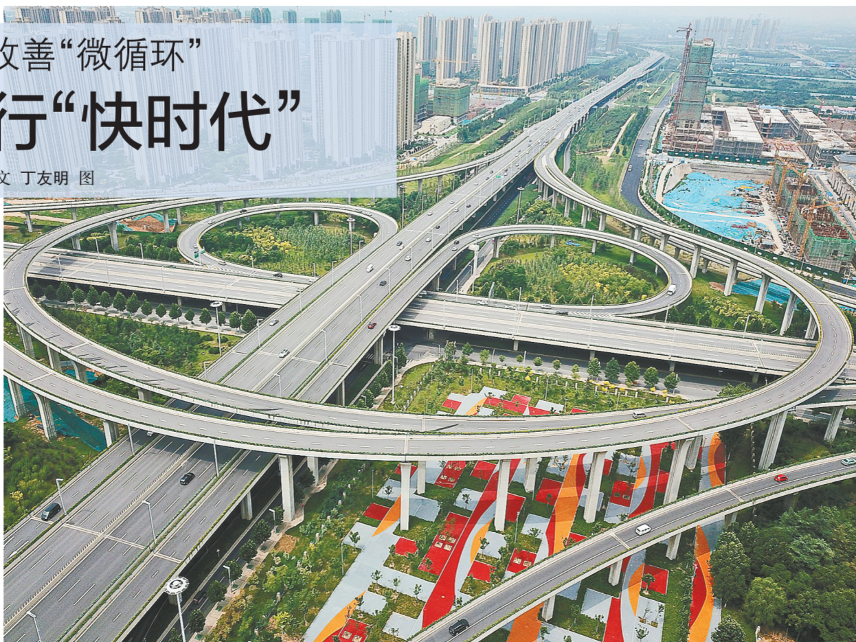
鸟瞰陇海路快速通道西四环立交桥

与此同时,作为主城区“两纵两横两环”快速路网系统中的外环——四环线及大河路快速化工程,高架主线已于今年6月底试通车,四环高架与三环形成双环并行,双环自由切换最多15分钟就能到达。(下转6版)