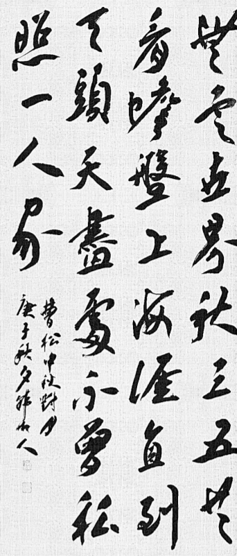
中秋对月(书法) 韩湘人

船到河洛镇，臬司的徐大人，把仓爷叫到了船头：我再问一遍，你听好了，这可是掉脑袋的事情。盗卖皇粮，此话当真？仓爷再一次保证说：句句属实。