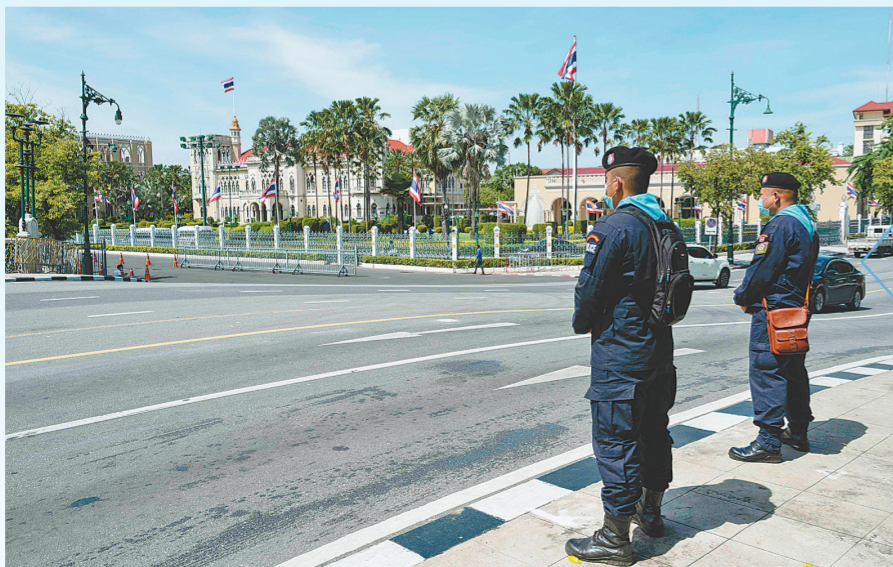
10月15日,两名警察在泰国曼谷街头执勤。

上万示威者18日冒雨走上首都曼谷街头,连续第五天举行大规模反政府示威。巴育当晚表示愿意倾听民众呼声,尊重示威权利。