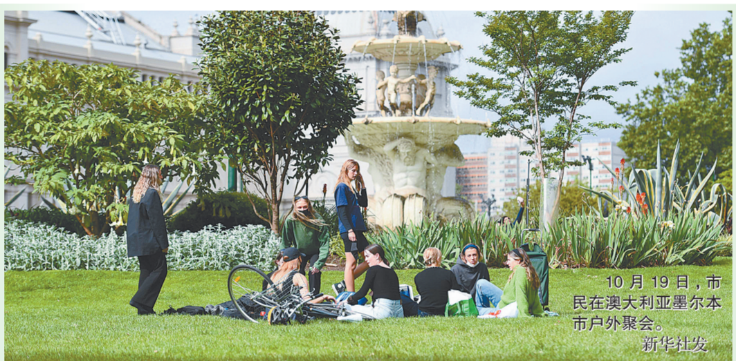
10月19日,市民在澳大利亚墨尔本户外聚会。