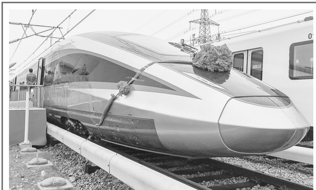
这是在中车长春轨道客车股份有限公司拍摄的时速400公里跨国互联互通高速动车组(10月21日摄)。

当日,我国自主研发的时速400公里跨国互联互通高速动车组,在中车长春轨道客车股份有限公司下线。列车可在不同气候条件、不同轨距、不同供电制式标准的国际铁路间运行,能让国际、洲际旅行更便捷。