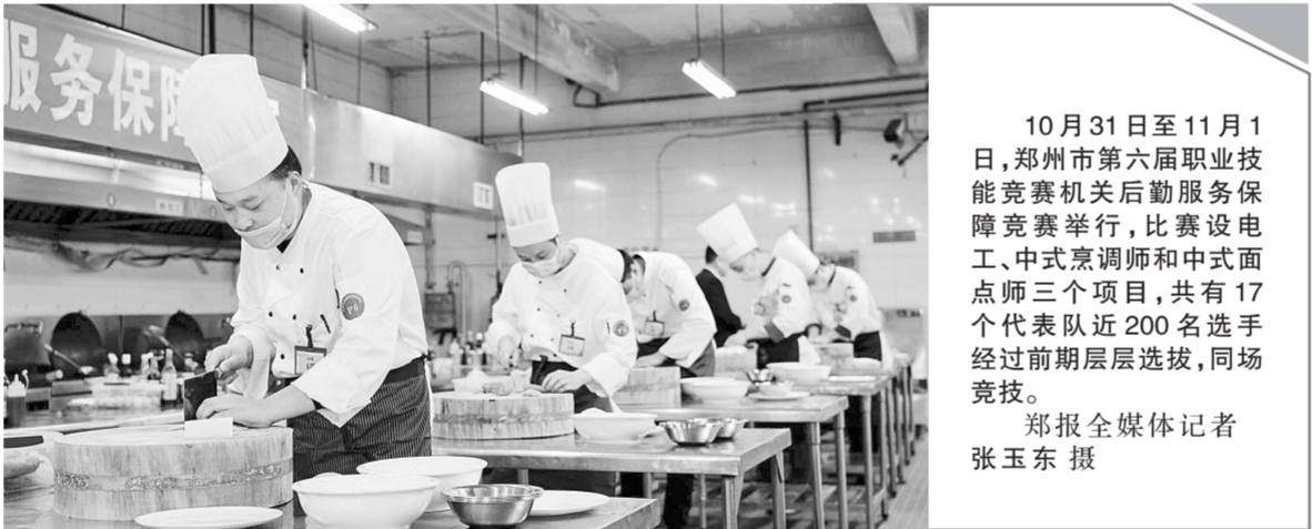
10月31日至11月1日,郑州市第六届职业技能竞赛机关后勤服务保障竞赛举行,比赛设工、中式烹调师和中式面点师三个项目,共有17个代表队近200名选手经过前期层层选拔,同场竞技。

中国记协将于近期举办第三十届中国新闻奖、第十六届长江韬奋奖颁奖报告会,为中国新闻奖特别奖、一等奖获奖者及长江韬奋奖获奖者颁奖。