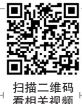
扫描二维码 看相关视频