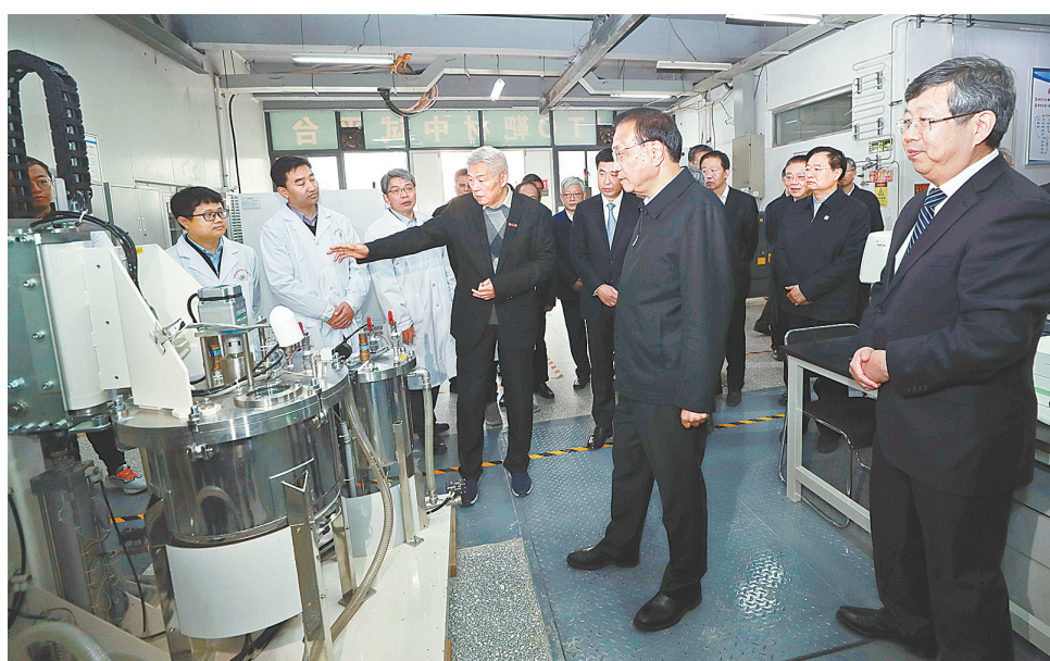
11月3日至4日,中共中央政治局常委、国务院总理李克强在河南安阳、郑州考察。这是11月4日,李克强在郑州大学考察科技创新工作。

在安鑫苑小区,李克强走进保障房住户家中察看居住情况。他说,加强保障房建设是推进新型城镇化的重要任务,建设、租售模式都可以因地制宜积极探索。要确保房屋质量。李克强询问小区居民还有哪些困难和意见建议,叮嘱要把群众冷暖挂在心上,群众反映的有些问题看似小事,但对自身来说可能