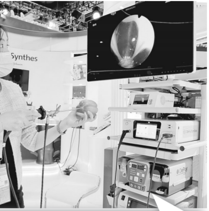
11月5日,在第三届进博会医疗器械及医药保健展区强生展台,工作人员借助工具演示关节镜成像系统。

在抗疫期间凭“救命神器”ECMO走红的美敦力,带来了新一代ECMO技术,能有效减少一次性耗材的更换频次,降低感染风险,同时可智能实现压力、血氧饱和度及温度等重要患者生理指标的实时、准确检测,有助于实现危重症患者转运移动化管理,为挽救患者生命争取