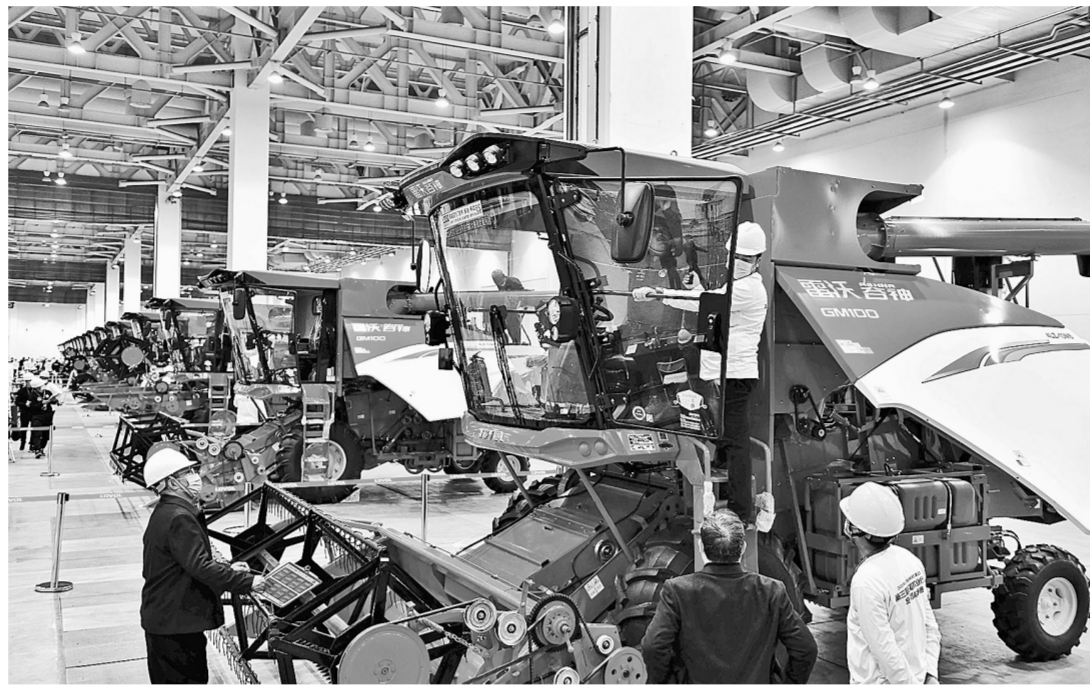
11月9日,第三届全国农业行业职业技能大赛在山东潍坊开幕。大赛设置农作物植保、农机修理、动物疫病防治等5个比赛项目。图为农机修理比赛现场。

新华社北京11月9日电(记者 赵文君)国家市场监督管理总局、公安部、农业农村部、商务部、中华全国供销合作总社联合部署的农村假冒伪劣食品专项执法行动电视电话会议9日在京召开,五部门将联合开展专项执法行动,严厉打击农村食品假冒伪劣违法犯罪。 此次专项执法行动的目标是查处一批违法案件,曝光一批典型案例,销毁一批违法食品,严惩一批违法犯罪分子。执法行动将聚焦案件查办,严厉打击食品中添加非食用物质、经营未经检验检疫的肉类、“三无”食品、“超过保质期”食品等人民群众深恶痛绝的违法行为。 执法行动重点关注农村、城乡结合部农贸市场以及食品批发商、小餐馆、校园周边小超市小商店等食品生产经营主体;重点关注元旦、春节、端午、国庆、中秋等节令食品集中上市、群众集中消费、食品消费量大的时间节点;重点关注生产经营劣质月饼、粽子、元宵等节令食品,假冒伪劣肉制品、乳制品、婴幼儿辅助食品、白酒、调味品等违法行为。 会议要求,各地要以对人民群众高度负责的精神,依法从严处罚。坚决落实食品安全“四个最严”要求,符合吊销许可证条件的,一律吊销;符合处罚条件的,一律从严处罚并处罚到人;涉嫌犯罪的,一律移送公安机关。