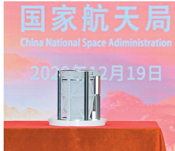
国家航天局举行的嫦娥五号月球样品交接仪式上亮相的月球样品容器（12月19日摄）。