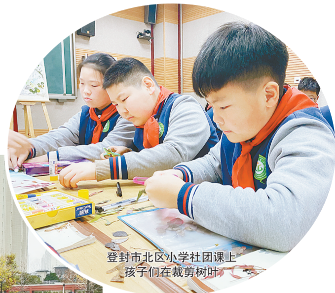
登封市北区小学社团课上 孩子们在裁剪树叶