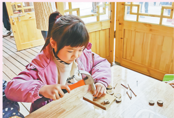
新乡市弘远路幼儿园孩子享受劳动实践的乐趣

智慧教育，给予校园和课堂更多神奇的可能，让优质教育资源传播得更远，润泽每一个孩子的成长，成就更多人的梦想。