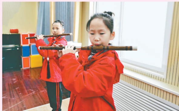
中牟县晨阳路学校的多彩音乐社团课激发无限潜能