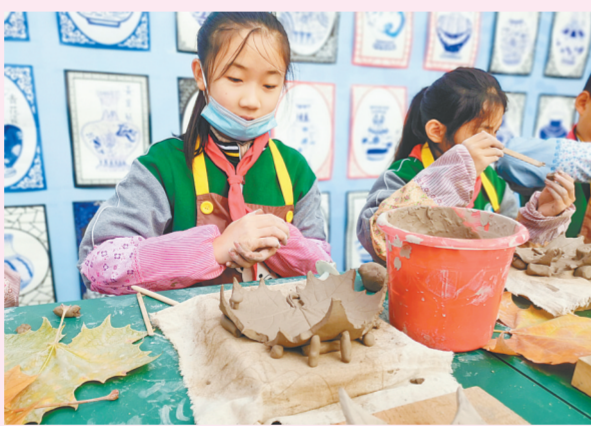
巩义市紫荆实验学校的陶艺课堂