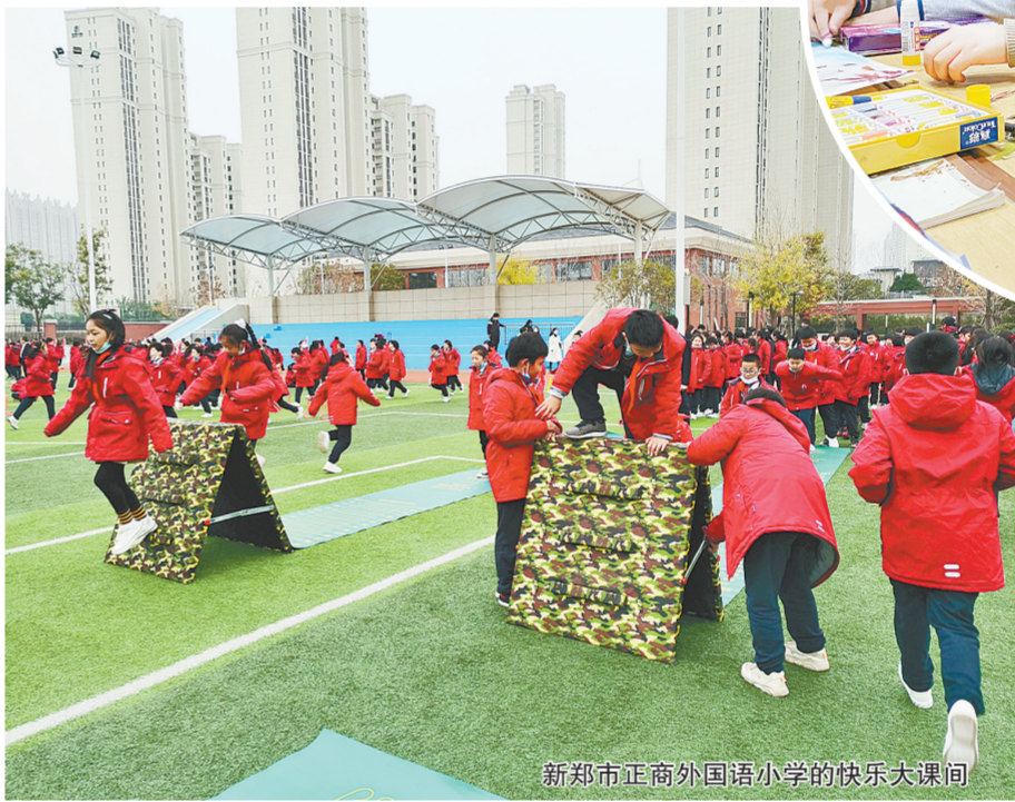
郑州市正商外国语小学的快乐大课间