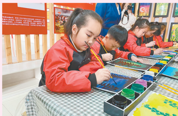
荥阳市第六小学学生认真作画