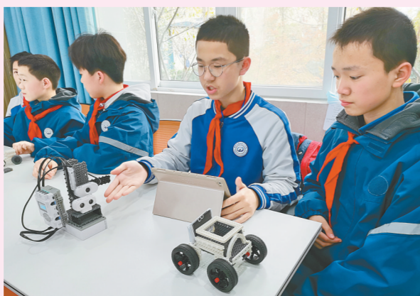
郑州市第四十七初级中学机器人编程课堂启迪学生智慧