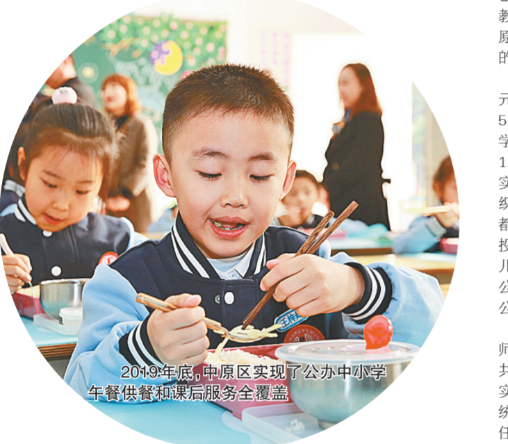
2019年底，中原区实现了公办中小学午餐供餐和课后服务全覆盖