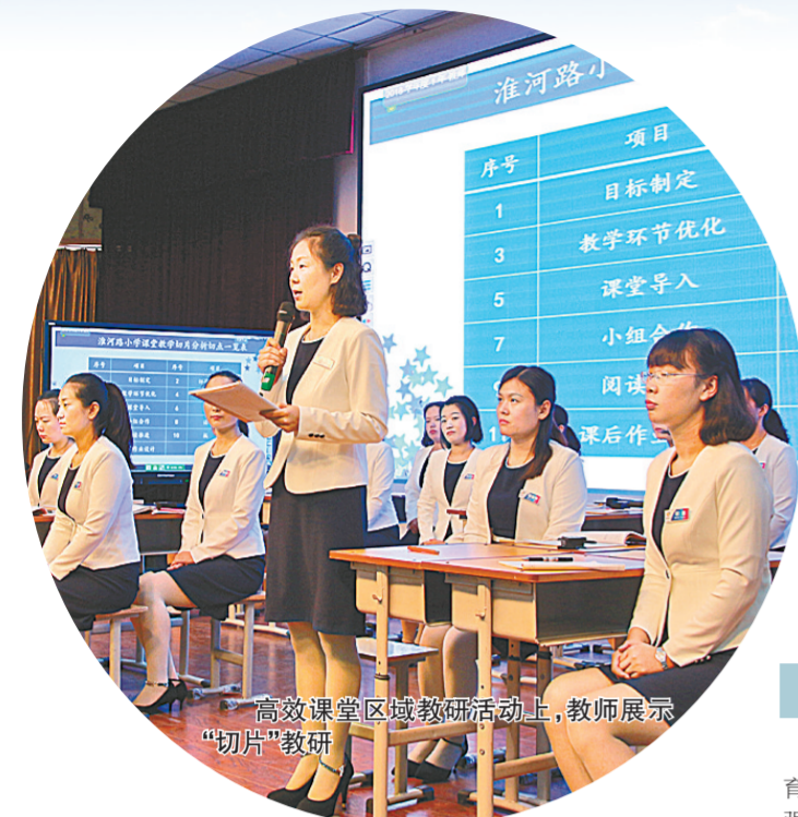
高效课堂区域教研活动中，教师展示“切片”教研

此外，中原区积极落实全市关于中小学午餐供餐和课后延时服务工作部署，按照“试点先行、全面开展”的工作思路，充分调研、稳妥推进，2019年12月初，实现了辖区公办中小学午餐供餐和课后服务100%全覆盖，把午餐供餐和课后服务做成了暖心工程、民生工程，提高了辖区群众的教育获得感和幸福感。