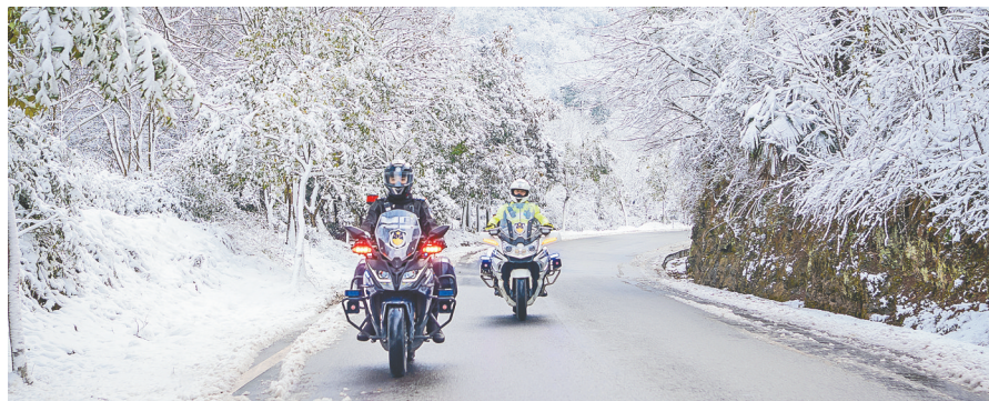
浙江省绍兴市新昌县公安局铁骑中队民警在儒岙镇会墅岭路段巡逻，提醒过往车辆雪后减速慢行(2020年12月15日摄)。

闪耀的警徽，标注神圣的使命。 诞生于红色革命根据地，脱胎于人民军队，这支世界上首个在“警察”名称前冠以“人民”二字的队伍，一路走来，浴血荣光。 亮正义之剑、守万家灯火、保安居乐业，他们的剑胆琴心、忠诚无畏代代传承。 时针，即将指向2021年1月10日——首个中国人民警察节。这是在国家层面专门为中国人民警察队伍设立的节日，这是党和人民赋予中国人民警察的崇高荣誉。他们，当之无愧！