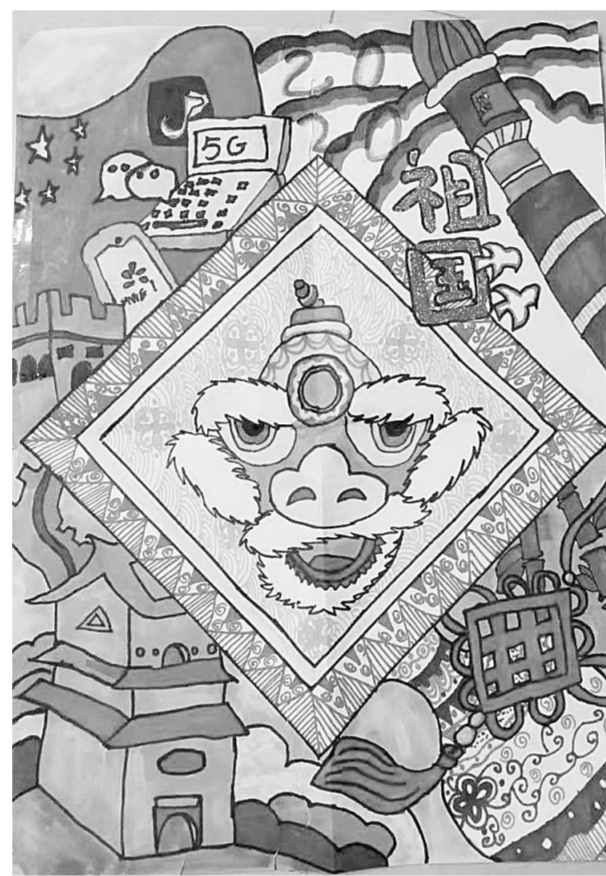
福满2020 金水区文化路第一小学 赵莹莹 辅导老师 姚媛