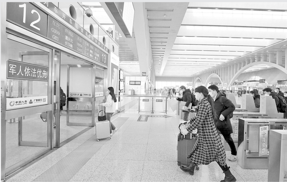
2月9日,在石家庄火车站,旅客通过检票闸机准备乘车。此前,鉴于石家庄市疫情形势,暂时对火车站实行临时性严控防控措施,所有乘客一律暂停进站乘车。