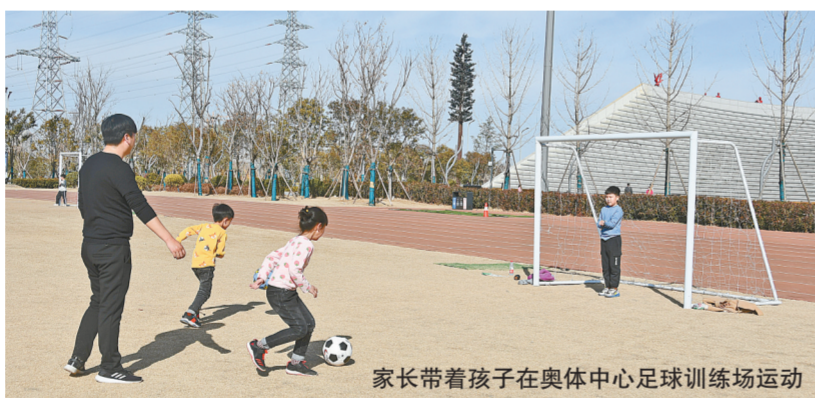
家长带着孩子在奥体中心足球训练场运动

春节假期,天气晴好。在“就地过年”的大背景下,运动成了人们丰富春节假期生活、增强防病抗病能力的重要选择。无论是在线上参加丰富多彩全民健身活动,还是在线下走进广场、公园、运动场进行体育锻炼,运动过年呈现出“热气冲天”之势。线上线下同出彩,春节期间中原大地浓浓的体育年味扑面而来。