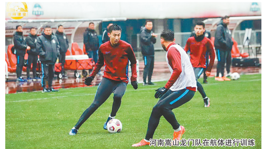
河南嵩山龙门队在航体进行训练

多种因素作用下,让为数不少的足球俱乐部的经营都身处困境,而一切切的“中性名”政策甚至让这些俱乐部连转让都非常困难,而一直保持相对稳定的嵩山龙门队,从人员上看,即便是不能说实力有明显提升,至少也是和去年相当,这也让人对球队新赛季的成绩有了更多期待。