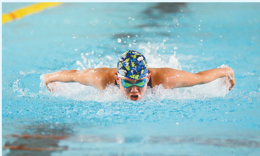
河南省游泳队一线队的队员在进行训练

强化心理、突出体能,为“两运”积极备战的河南泳军,正通过先进的理念和战法谋划出彩新篇章,力争在“两运”上再创佳绩。