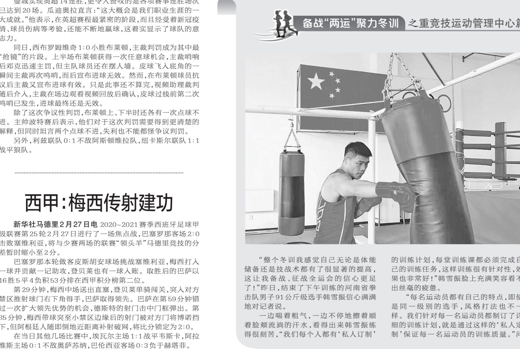
备战“两运”聚力冬训 之重竞技运动管理中心篇