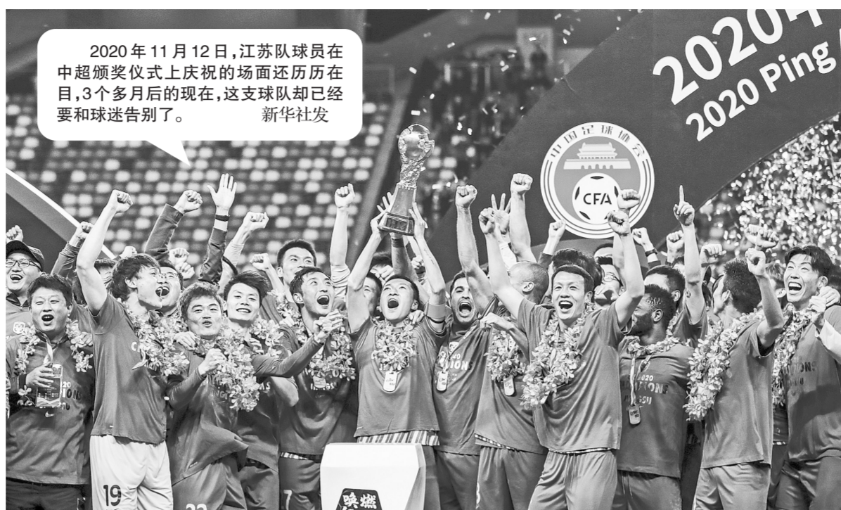
2020年11月12日,江苏队球员在中超颁奖典礼上庆祝的场面还历历在目,3个月后的现在,这支球队却已经要和球迷告别了。

苏宁集团2015年底接手江苏足球,曾引入特谢拉、拉米雷斯、卡佩罗等高水平球员和教练,球队战绩一直位居中超联赛前列,并于2020赛季夺得中超冠军。苏宁女足在2019赛季获得国内赛事“大满贯”。新赛季备战期,主帅奥拉罗尤和外援均未归队,关于球队难以维系、正寻找下家的传言不断。