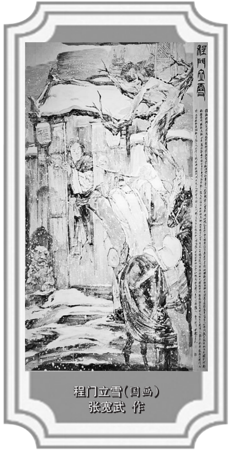
程门立雪(局部) 张发武作

三门峡市博物馆藏有一块石匾,上书“藩篱”二字,为全国目前发现的姚崇唯一的手迹,也是姚崇做人、做事、做官的准则。“夜宿带浮烟,苍茫晦远天。舟轻不觉动,缆急始知牵。听草遥寻岸,闻香暗识莲。唯看孤帆影,常似客心悬”。姚崇一生忙碌,唯有这首诗,才让我们约略看出他暂得悠闲的一颗诗心。