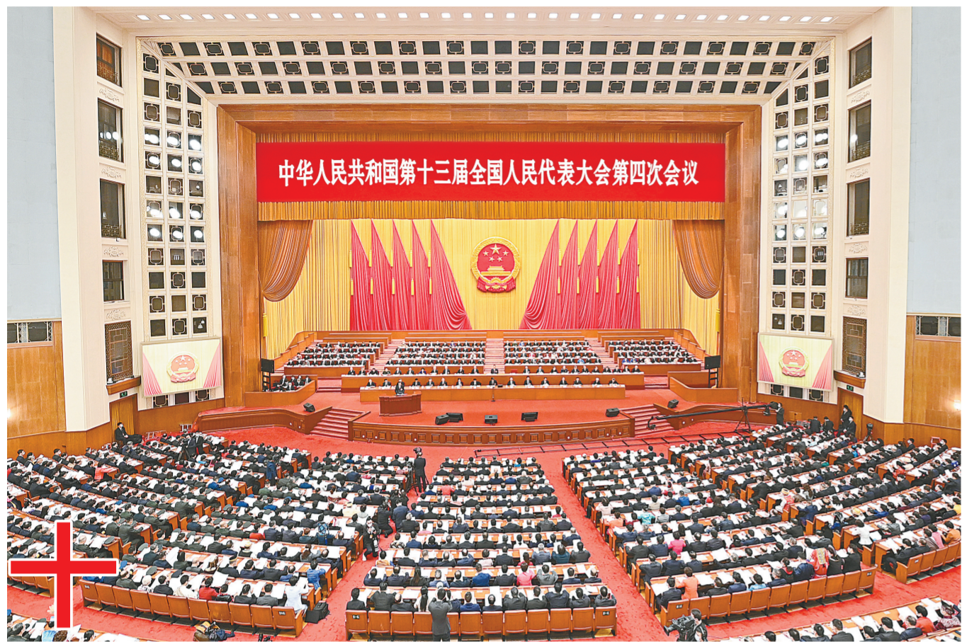
3月5日,第十三届全国人民代表大会第四次会议在北京人民大会堂开幕。