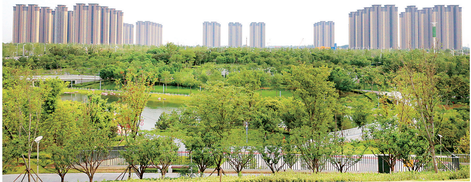
▲▼航空新城里的幸福生活