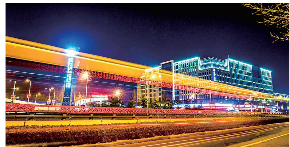
航空新城璀璨夜景