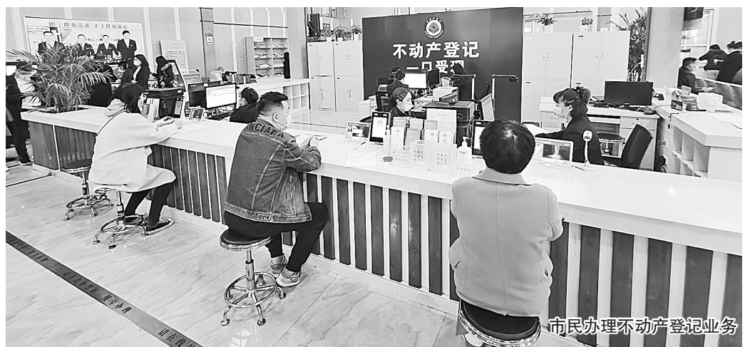
市民办理不动产登记业务

效率,以“一套资料申报、一个窗口受理、一个流程办理、一套系统审批、一次即可办结”为工作要求,完成不动产窗口改革创新,形成同时受理合同网签、资金监管、缴税等不动产登记业务无差别办理的大综窗“一口受理”服务模式,让郑东新区不动产登记分中心迎来了新的变革。