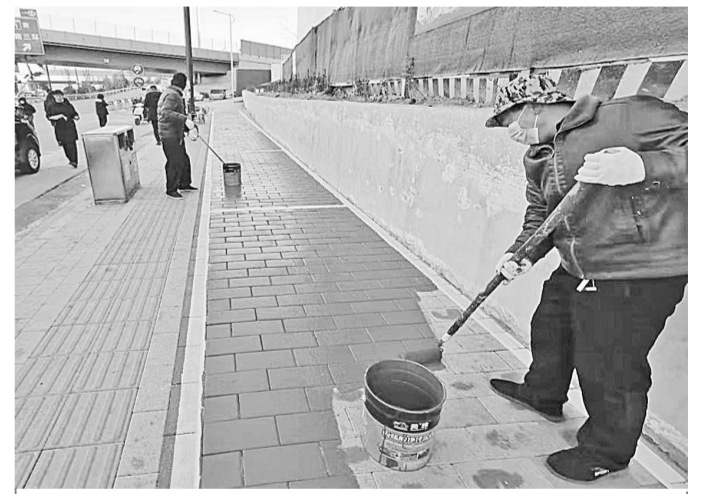
昨日,管城区金岱街道对沿街单位、店铺门前的人行道施划非机动车临时停车泊位,规范非机动车停车秩序。

在旧址门外,面对党旗,全体党员重温了入党誓词。党员们针对学习教育活动,逐一交流学习感想、体会,纷纷表示在思想和精神上接受了一次深刻的洗礼。(魏梦苑)