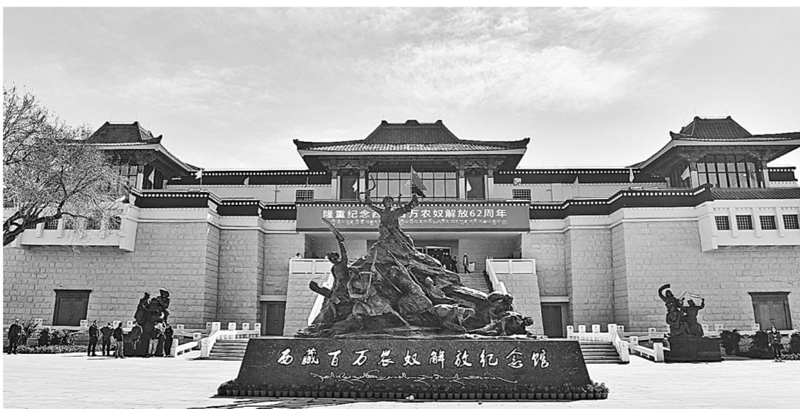
28日,西藏百万农奴解放纪念馆新馆开始接待社会各界参观。

据新华社拉萨3月28日电(记者 王泽昊 王沁鸥)在西藏实行民主改革62年后,3月28日,我国唯一一个关于废除农奴制的纪念馆——西藏百万农奴解放纪念馆新馆在拉萨正式开馆。