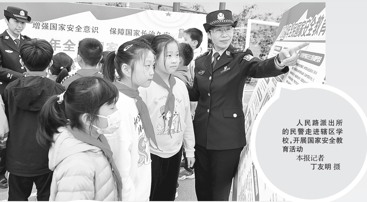
人民路派出所的民警走进辖区学校,开展国家安全教育活动

郑州大学实验小学在全校范围内开展“全民国家安全教育日”主题活动。该校五年级学生在报告厅举行了一场有关国家安全教育日的知识竞赛,书法社团高年级学生则用毛笔书写国家安全宣传标语。据悉,此次集中宣传活动在金水区、郑东新区、上街区、巩义市、新郑市、中牟县等9个县(市)区同步开展。