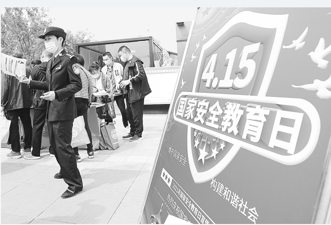
在惠济区万达广场,宣传员现场发放国家安全教育日宣传材料