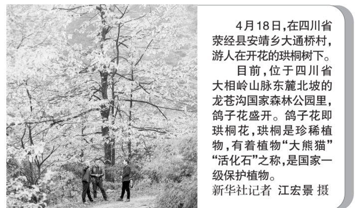
4月18日，在四川省荣经县安靖乡大通桥村，游人在开花的珙桐树下。

目前，位于四川省大相岭山脉东麓北坡的龙苍沟国家森林公园里，鸽子花盛开。鸽子花即珙桐花，珙桐是珍稀植物，有着植物“大熊猫”“活化石”之称，是国家一级保护植物。