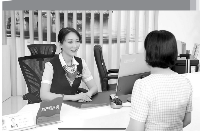
客户在国网郑州供电公司营业厅共产党员示范岗办理业务