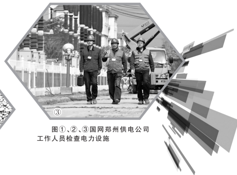
图①、②、③ 国网郑州供电公司工作人员检查电力设施