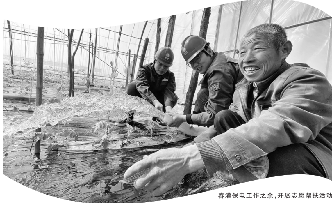
春灌保电工作之余,开展志愿帮扶活动

在“十四五”开局之年,国网郑州供电公司持续发力,进一步优化电力营商环境,改进服务体系,创新提出政企协同、业务联动、网格化服务前端融合等先进的服务举措,利用互联网技术,构建时间短、环节少、造价低、服务优的客户办电新模式,提升客户办电满意度、用电获得感,相关工作经验做法被发改委编入《2020中国营商环境报告》。