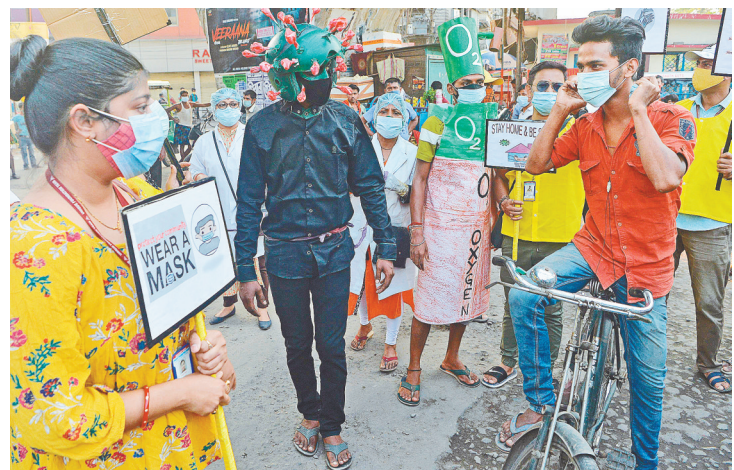
4月25日,一名男子戴着新冠病毒形状的头盔在印度西里古里街头宣传防疫知识。

新华社新德里4月26日电(记者胡晓明)印度卫生部26日公布的数据显示,该国较前一日新增新冠确诊病例352991例,已连续5天单日新增病例超过30万例,累计确诊17313161例;新增死亡2812例,累计死亡195123例。