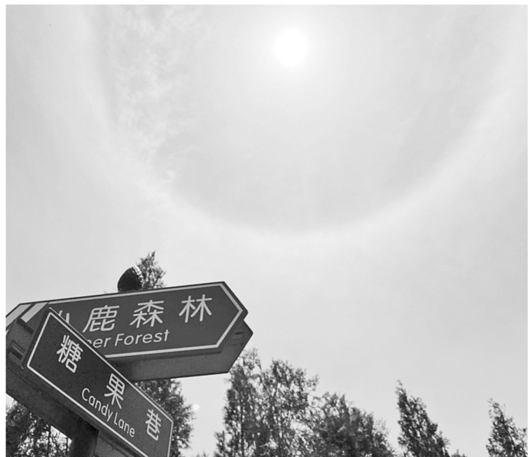
新密伏羲山观察到的日晕

本报讯(记者 武建玲 通讯员 弋慧星 文/图)昨日,我市天空呈现美丽日晕,像是给太阳戴上美瞳,不少市民拍下了这一美丽的光学现象。