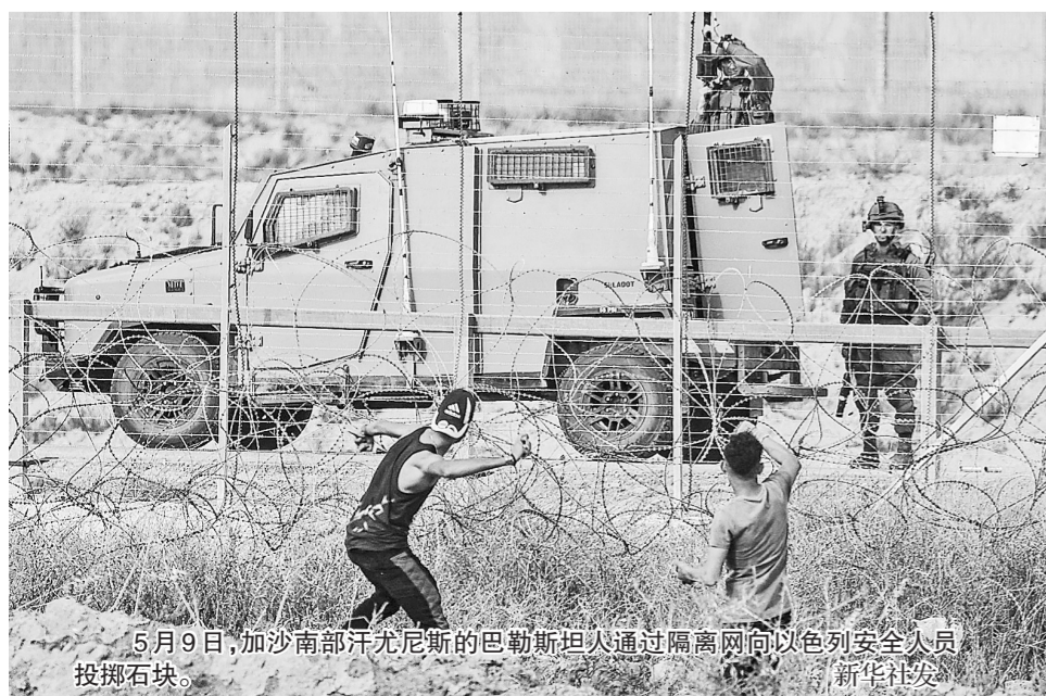
5月9日,加沙南部汗尤尼斯的巴勒斯坦人通过隔离网向以色列安全人员投掷石块。

巴勒斯坦民众与以色列警察10日在东耶路撒冷爆发新一轮冲突,超过300名巴勒斯坦人受伤。