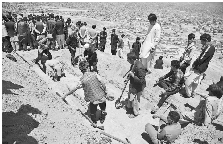
5月9日,在阿富汗喀布尔,人们准备埋葬遇难者。

分析人士指出,自从美国和北约军队1日正式开始从阿富汗撤军以来,阿富汗局势持续恶化。美国为从战争泥潭脱身以不负责任的方式从阿富汗撤军,此举导致的恶果已初步显现,但为此承受灾难的是阿富汗民众。