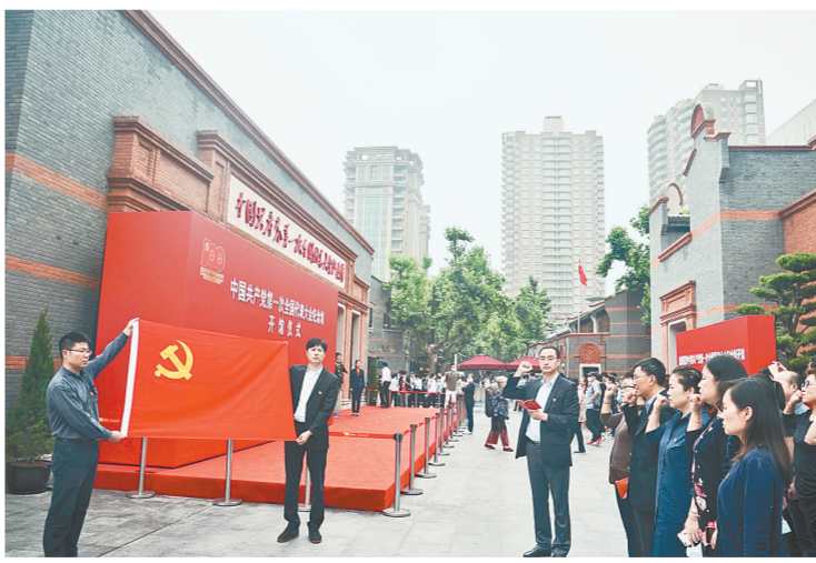
6月3日，党员在中国共产党第一次全国代表大会纪念馆外重温入党誓词。

展览共7个板块，分别为“历史选择 伟大起点”“前仆后继 救亡图存”“民众觉醒 主义抉择”“早期组织 星火初燃”“开天辟地 日出东方”“砥砺前行 光辉历程”“不忘初心 牢记使命 永远奋斗”，生动体现中国共产党的诞生和百年奋斗历程。