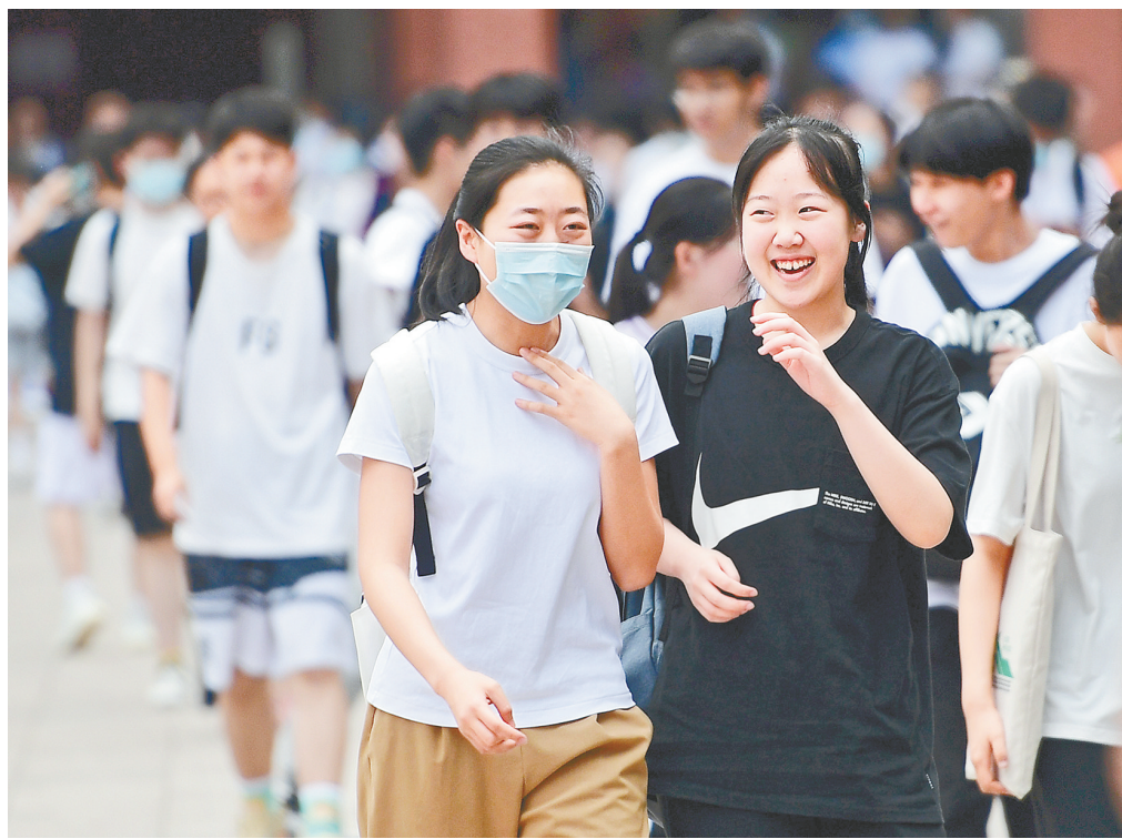
昨日上午,首场考试结束后,考生轻松走出考场