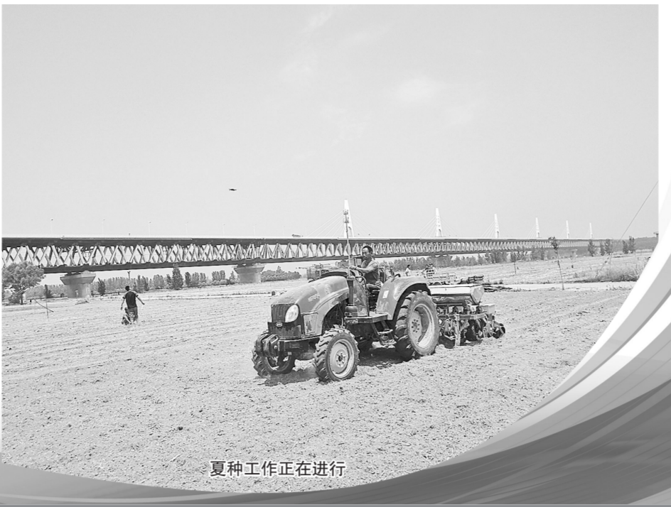
夏种工作正在进行

今年,我市“三夏”麦收工作部署早、行动快、物资准备充足,新型收割机投入量大,加上近期天气给力,墒情良好,小麦收获和玉米播种进度都较快,麦收机损率低。“三夏”期间,全市共投入各类农机具25万台套,高峰期每日投入小麦收割机5000余台,日进度20万亩。目前我市“三夏”麦收基本结束,夏粮丰收已成定局。