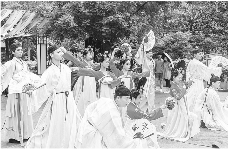
端午假期,方特梦幻王国推出的古风舞蹈让游客体验到传统文化之美。

“青春市集”“趣味社团活动”等系列趣味互动活动,还可免费体验“做香囊”“画雄黄”“系五彩绳”等传统端午民俗。当夜幕降临,璀璨的“城堡灯光秀”、炫酷的“荧光派对”、劲爆的“毕业狂欢趴”等精彩演出轮番上演。端午假期,方特水上乐园也延长营业时间至21:00。游客除畅玩乐园经典的水上游乐项目,还能观看炫酷刺激的“水上飞人”表演,参与水上“电音派对”,畅享夏日戏水狂欢。 方特梦幻王国推出的“端午游园会”系列活动,更是传递着浓郁的中华传统文化。不少游客走进“端午民俗坊”,体验插艾叶、缠丝带等特色民俗活动,了解传统端午文化。 梦幻多彩的花车、古典优雅的汉服……端午小长假,郑州园博园每天推出两场花车巡游,开启一段古风汉服之旅。花车巡游期间,该景区还在扬州桥、南门广场特别设置互动区域,为游客发香囊、系五彩绳,送上节日祝福。园博园演艺团队还依托各城市展演独特风格,精心编排多样的国风演艺。