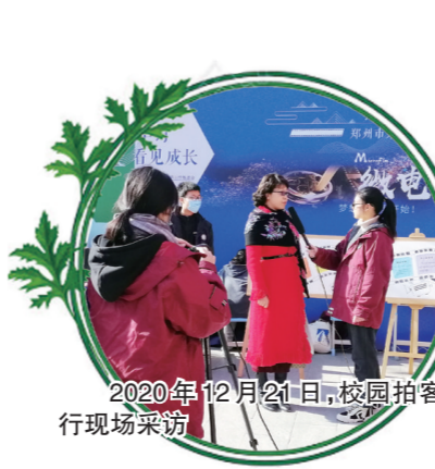
2020年12月24日，校园拍客进行现场采访

综合实践特色课程《校园拍客》荣获全国第三届真爱梦想杯校本课程大赛特等奖；“灵智课堂”通过郑州市道德课堂有效形态第二轮认证，并荣获金水区“课程改革20年成果”二等奖……“智立方”课程体系的优劣势已