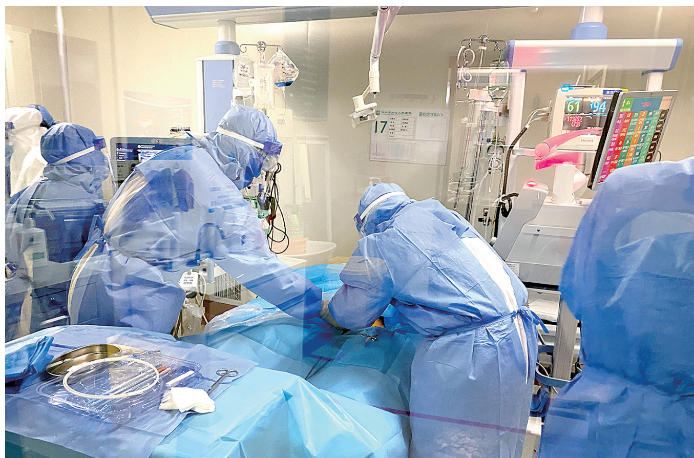
重症医学科使用 ECOM 治疗新冠肺炎重症患者

该院就是河南省传染病医院(郑州市第六人民医院)。近年来,秉承“仁爱、精诚、专业、卓越”的服务理念,该院锐意拼搏、砥砺前行,形成了以艾滋病等四大优势学科为基础,集内、外、妇、儿、重症救治等为一体的传染病综合救治体系,成功创建了我省唯一一所三级甲等传染病医院,现正朝着创建“立足中原、面向中部、辐射全国”的传染病区域医疗中心目标奋力迈进。