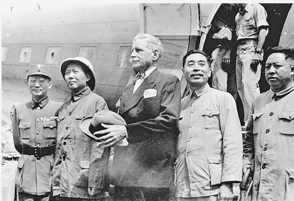
1945年8月28日，为争取国内和平，毛泽东和周恩来、王若飞在赫尔利、张治中陪同下离开延安赴重庆谈判