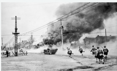
1949年1月14日，中国人民解放军攻入天津市