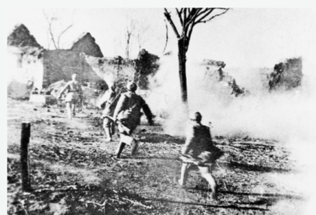
淮海战役中，人民解放军扑向国民党军的指挥所鲁楼