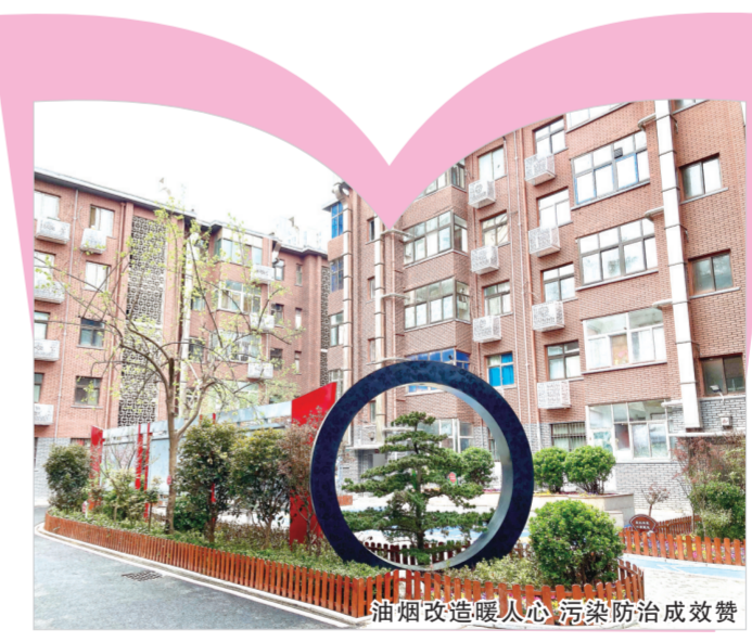
油烟改造暖人心 污染防治有成效

型”小区,建成年代早、占地面积小、居民户数少是这类小区的主要特征,也是大学路街道老旧小区的普遍现状,环境提升迫在眉睫。今年,街道以47号院为试点,打造“全要素建设”典型楼院,解决群众所急、所需、所难。在改造工作中,以一拆五改三增加”为主要内容,践行为民服务理念,坚持有的放矢顺民意的原则,听民声、纳民谏,实施四类功能提升项