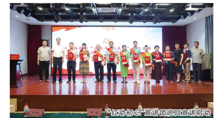
“红动初心”宣讲团巡回宣讲启动