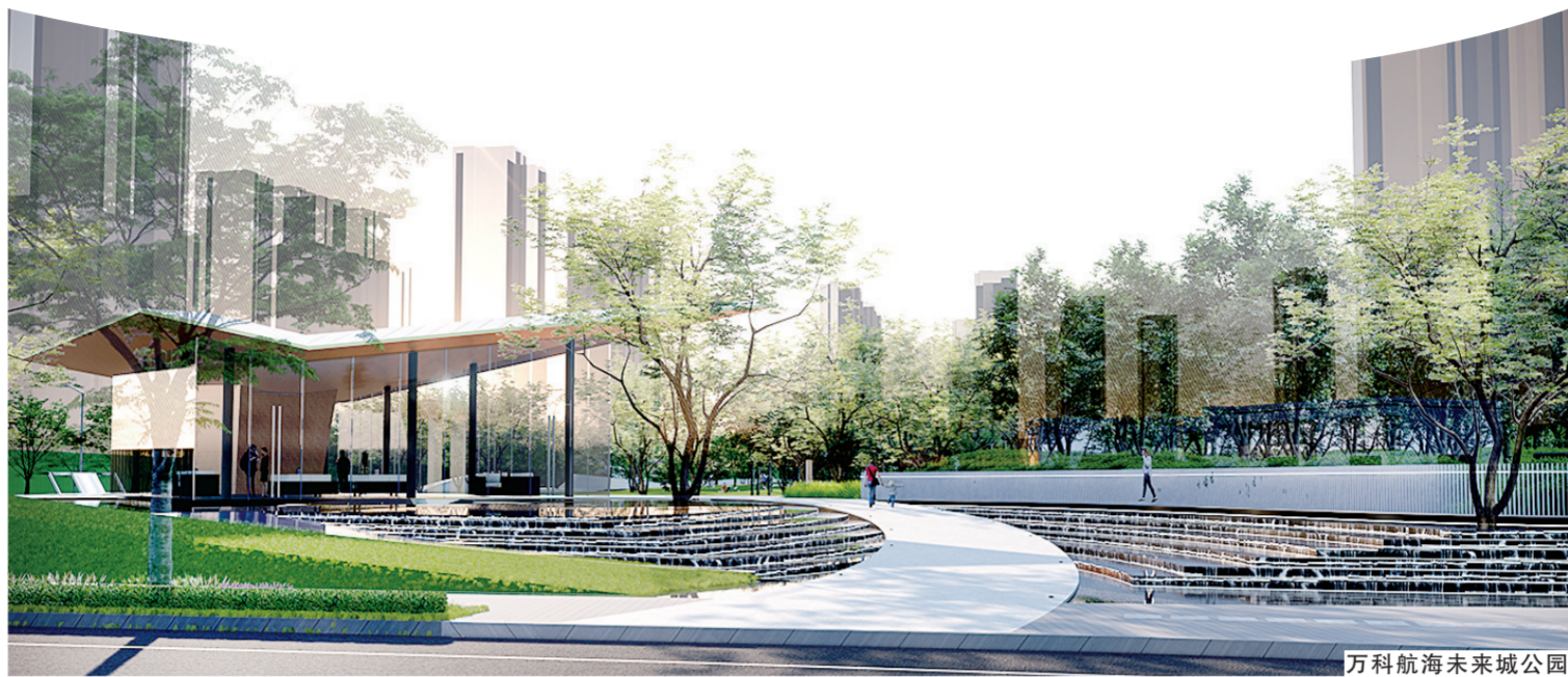
万科航海未来城公园

科技引领“新平台”,以浪潮大数据产业园、采筑平台中部地区总部经济园为代表的八卦庙——上闫洞万科大数据产业板块,其中,作为国内大数据和云计算领域的优秀企业,投