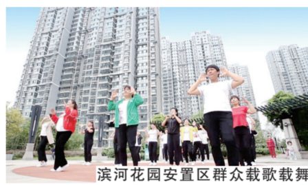
滨河花园安置区群众载歌载舞