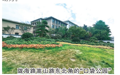
航海路嵩山路东北角的“口袋公园”

利用区位优势,把“软优势”转化为“硬实力”。街道紧抓地铁1、7、9、10号线和K2线建设,在中原路与嵩山路、中原路与大学路、大学路与航海路形成三向、双向交汇的交通新优势。依托地铁建设辐射周边区域,谋划地铁商圈经济,推动大众创业、万众创新,迸发街区发展活力;高标准谋划兑周C地块、欧亚连片、机械研究所、信心药业片区等4个项目,增强街区发展后劲;加快与郑州轨道公司、华润置地、中国电建地产集团、郑州瑞隆置业等公司对接,量身定制落地方案;谋划启动兑周A、B地块招商,力争将该项目建设成为区域发展的新动力。