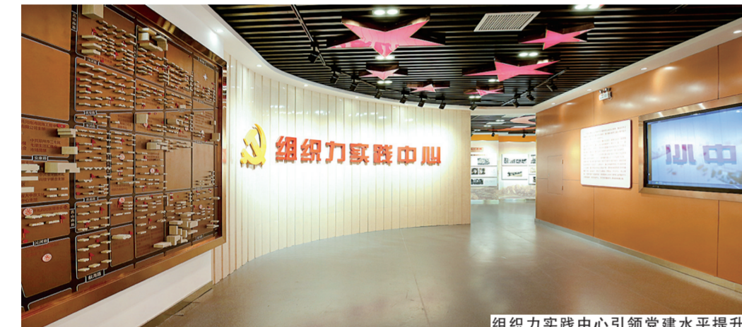
组织力实践中心引领党建水平提升

“今天，把大家组织起来，主要是想和大家一起商议一下物业管理的问题，我们专门邀请了裁判员、民调员和社区民警一起参加……”日常工作中，连心胡同运用“一领四单”和“四员进社区”组