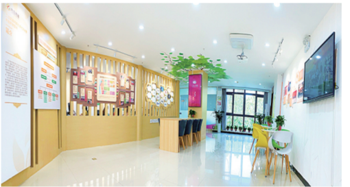
光合共创空间凝聚社区治理服务合力

近日，街道又打造了“光合共创空间”，建成全市标准化社会工作服务站和街道级社区社会组织培育发展示范基地，实施“微设施”“微改造”“微服务”“微心愿”“微治理”等5个方面17个微实项目，把管理和力量逐渐放到基层，把暖心事办在群众心坎上。