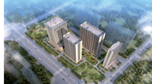
航海铭筑商务楼宇鸟瞰图