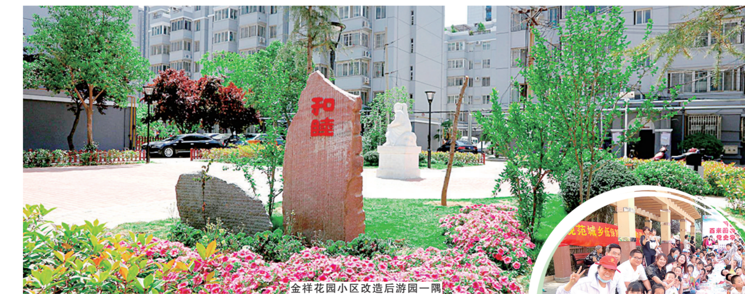
金祥花园小区改造后游园一隅

街道深入研判辖区内企业情况，加强小微企业服务力度，成功打造“双创”十字街区，着力发展楼宇总部经济，实现经济发展晋位升级。依托黄河科技学院双创基地、航海广场大学生创业园，统筹辖区都市广场、创富欣城、菁英商务中心、航海铭筑（在建）等商务楼宇资源，持续加大楼宇经济招商、总部经济招引，着力引进“三力”型项目。