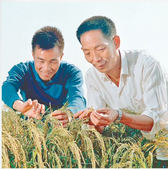
袁隆平(右)在观察杂交水稻生长情况