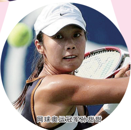
网球奥运冠军孙甜甜