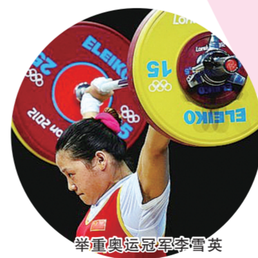
举重奥运冠军李雪英