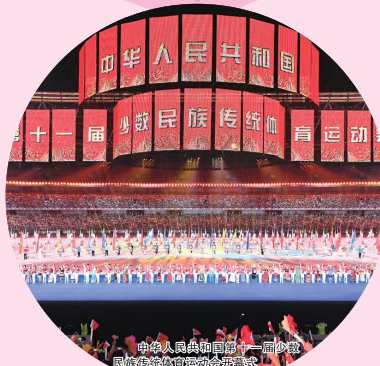
中华人民共和国第十一届全国少数民族传统体育运动会开幕式

目前，郑州市全市人均体育场地面积1.96平方米，各类体育场地25138个，体育场地总面积(含学校和社会场地)2029.8926万平方米，体育人口达35.6%。建成市奥体中心，新建区县(市)级全民健身中心6个，全市86个乡镇(办)建设了体育健身工程，覆盖率达100%。公共体育场馆开放率达100%。成立市级单项体育协会34个，经批准成立的市级体育俱乐部84个，基层健身指导站点达4430个，全市社会体育指导员达37066人，每千人社会体育指导员3.7人，极大地促进了群众体育在郑州市的普及和发展，助推全民健身与全民健康深度融合。