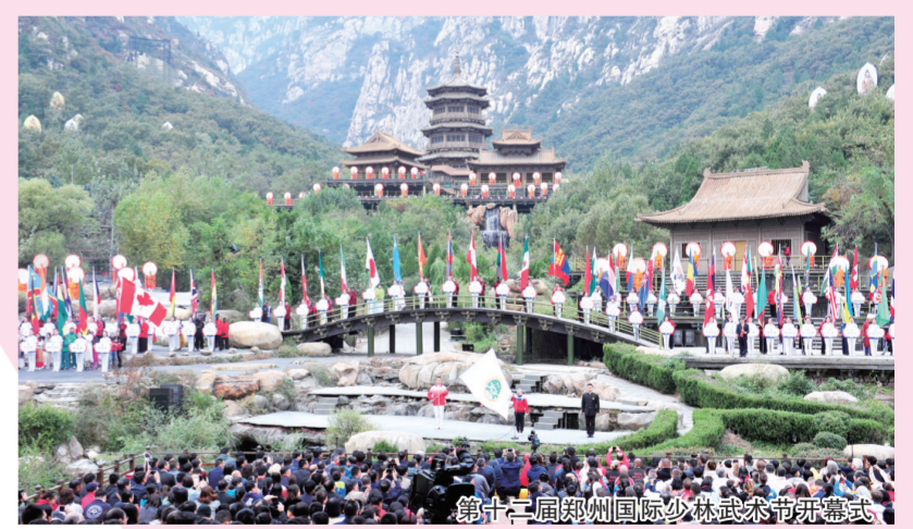
第十三届郑州国际少林武术节开幕式

特别值得一提的是，2020年11月在郑州奥体中心举行的2020国际乒联总决赛，成为疫情以来国内举办的首个允许观众现场观赛的国际性体育赛事。郑州体育人紧紧围绕最佳的安全保障、最佳的赛事组织、最佳的接待服务“三个最佳”目标，坚持“赛事要精、活动要简、防疫要准”的原则，以万全准备确保了零失误，以万全之策确保了零差错，以万无一失确保了零缺憾，圆满成功地举办了此项赛事。“国际郑”又一次蜚声中外。2020国际乒联总决赛筹委会被国家体育总局授予“全国体育事业突出贡献奖”，赛事被评为“2020全国体育十佳赛事”。