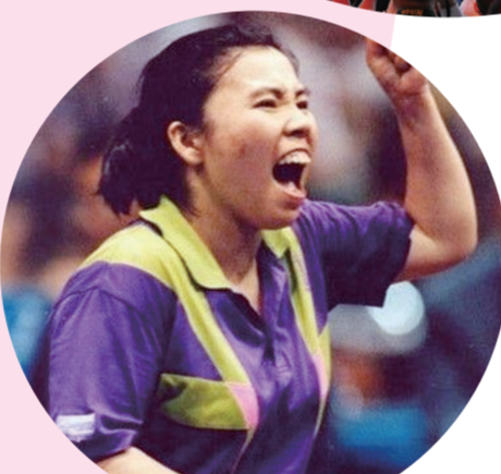
乒乓球奥运冠军邓亚萍

郑州竞技体育运动项目不断优化，核心竞争力不断提升，成就了郑州健儿在国内外赛场上屡创佳绩，向世人展示了中原儿女的崭新形象和郑州建设现代化国家中心城市所取得的巨大成就，为郑州赢得了巨大的荣誉，成为中原儿女凝心聚气的强大力量。