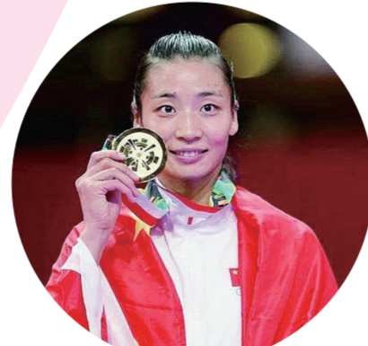
空手道世界冠军尹笑言