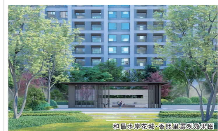
和昌水岸花城·香熙里景观效果图

在中国共产党成立100周年之际，和昌物业组织开展庆祝中国共产党成立100周年系列活动。6月20日，为传承红色基因，培养孩子们爱国爱党意识及艰苦奋斗的优良作风，和昌物业举办了以“童心向党 快乐成长”为主题的红色夏令营，孩子们在体验的过程中学会了感恩、掌握野外生存知识，收获了友谊，更加珍惜当前的幸福生活。