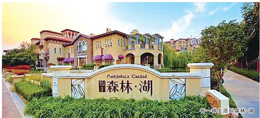
有一种生活叫森林·湖