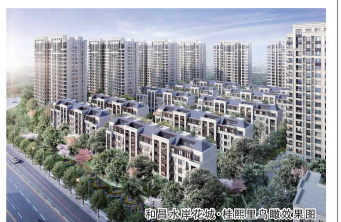
和昌水岸花城·桂照里鸟瞰效果图