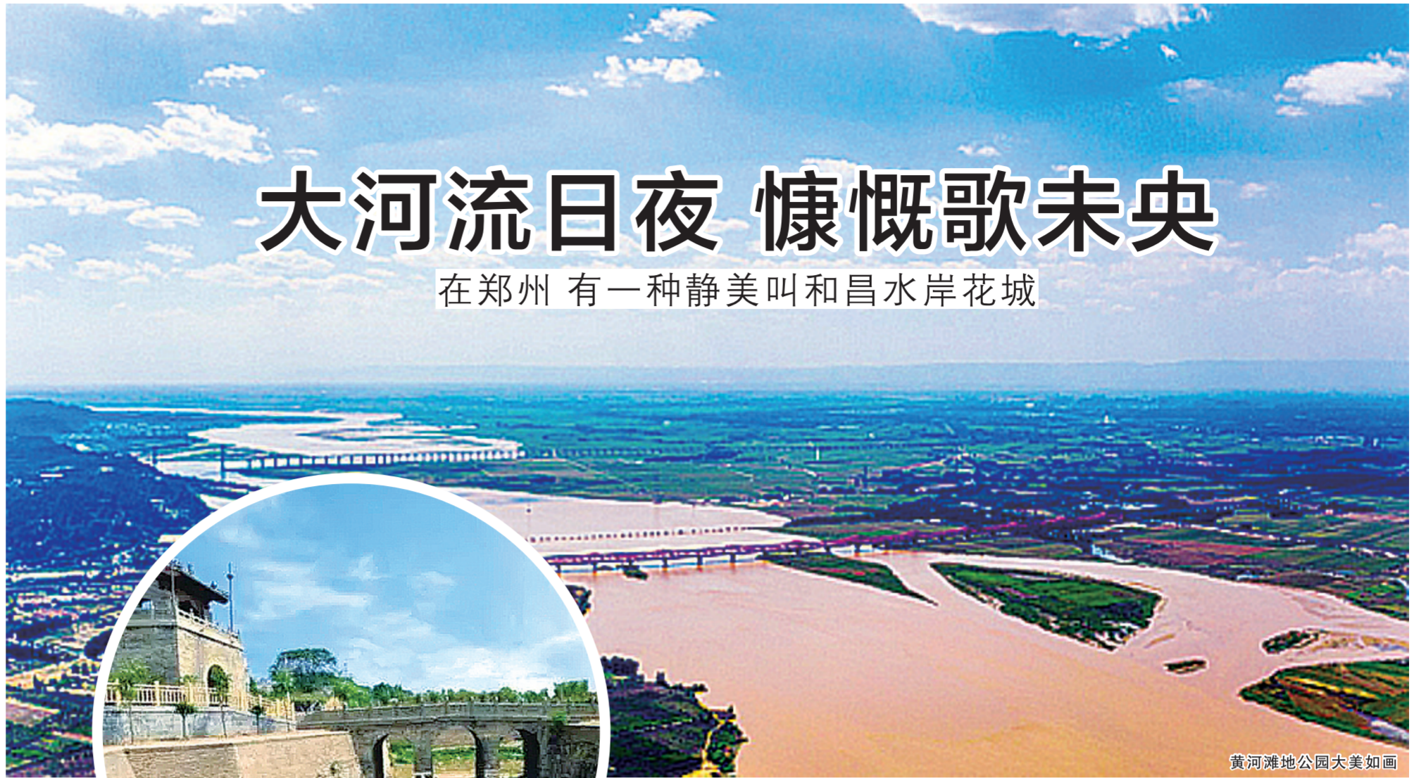
黄河滩地公园大美如画

15年前，和昌集团拓荒郑北落子惠济，“有一种生活叫森林·湖”成为郑州市民家喻户晓的流行语，50多万平米的生态宜居大盘引导郑北人居风向。5年前，和昌集团在惠济花开二度，千亩大盘水岸花城恢弘启幕。和昌集团作为生于斯、长于斯、成于斯的郑州本土房企，深爱郑州这片厚土，对惠济更是一往情深，有着浓得化不开的情缘。作为惠济区房地产开发的力行者、践行者、先行者，15年间，和昌与惠济共“城”长。如果说一部河南史，半部中国史，则和昌在惠济区的筑城不辍历程，已成为惠济区城市运营、城市化进程的见证者。