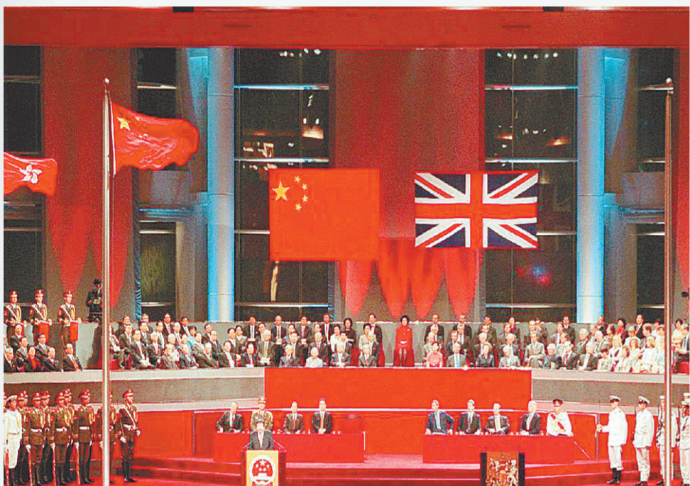
1997年6月30日午夜—7月1日凌晨,中英两国政府香港政权交接仪式在香港举行,宣告中国对香港恢复行使主权