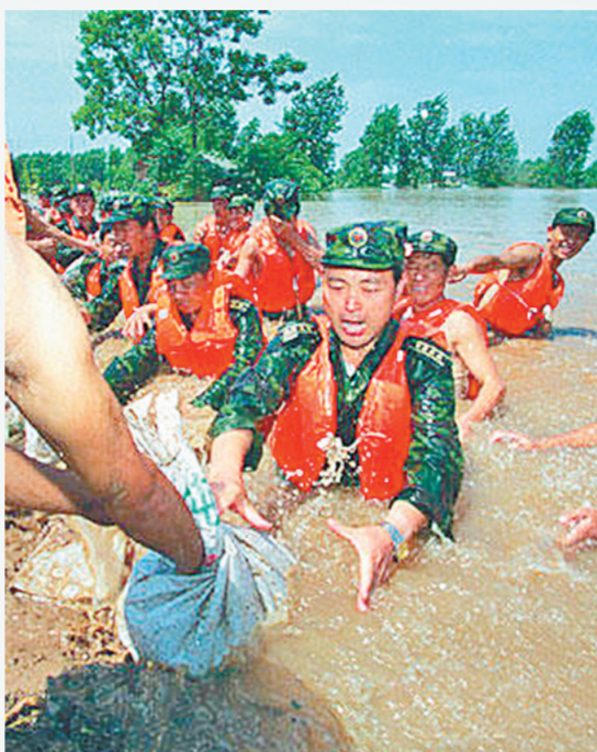
1998年6月,南方特大洪灾。全党全军全国人民团结奋战,取得抗洪抢险斗争的全面胜利