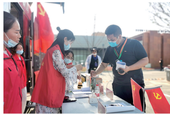
党建直通车开进景区为游客免费服务