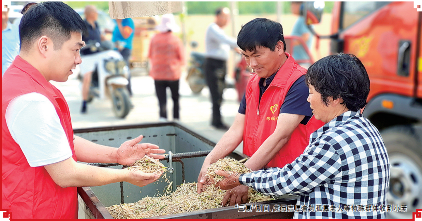
“三夏”期间，党员志愿者帮助孤寡老人等特殊群体收割小麦

拓宽“红色阵地”“持续学”。为使党史学习教育在基层党员和群众中入脑入心、生根发芽，充分发挥基层党员群众首创精神，创新推出“小板凳宣讲会”“小院党史讲堂”“百姓宣讲员进基层宣讲”等形式，走进社区街头、走进田间地头、走进群众心头，进一步扩大“红色阵地”，让基层党员群众用“乡音乡情”，讲好党的历史，推动党史学习教育接地气、有温度、见实效。其中，“‘小板凳’宣讲”“小院讲堂”……让党史学习教育“飞入寻常百姓家”“中牟‘微宣讲’让信仰的力量‘声入人心’”被《河南日报》刊发。东风路街道举办的“小板凳”宣讲被河南电视台《河南新闻》刊播。省委、市委党史学习教育领导小组办公室相关负责人分别于5月18日、21日对中牟县“小板凳”宣讲进行了实地调研，并给予充分肯定。同时，中牟县组织的“学党史、悟思想”读书班、“河南中牟学党史办实事紧密结合 倾力打造一流营商环境”、“河南中牟开设党史学习教育特色课程 全员培训村‘两委’干部”以及“学党史 悟思想 感党恩 聚民心”圆方智慧大党课走进河南中牟郑庵镇”等一批优秀稿件被“学习强国”河南学习平台、郑州学习平台采用。同时，通过在全县中青年干部、基层党代表、创业先锋、道德模范中进行遴选，最终以“党校系统教师、专家学者、领导干部、先进典型”为主力，兼收全县各系统、各层次授课人才资源，遴选县级宣讲师资29名组建县级宣讲团，已向全县印发党史学习教育专题宣讲安排，要求集中1个月，实现党史学习教育专题宣讲全覆盖。目前，共开展党史学习教育专题宣讲326场次，受众达8万余人次。此外，创新组织开展“巾帼向党、童心向党、永远跟党走、同心庆华诞、家乡黄河情”等系列红色文化主题活动，力争让红色教育在中牟大地上落地生根。