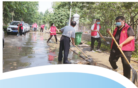
党员志愿者在无物业小区开展义务劳动