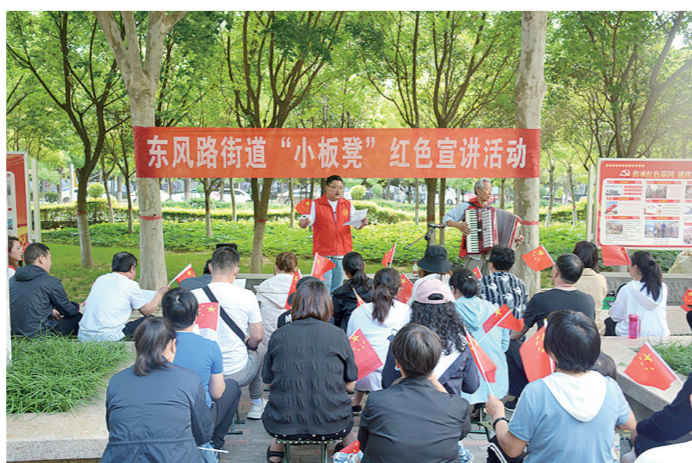
在公园举行的“小板凳”宣讲活动

与深化政务服务改革便民利民相结合。聚焦优化营商环境，为方便企业和群众办事，以制度创新、流程再造、平台优化为突破口，做出推进“一网通办、一次办成”政务改革；持续推进网上政务服务能力提升；建立健全营商环境投诉处理机制。