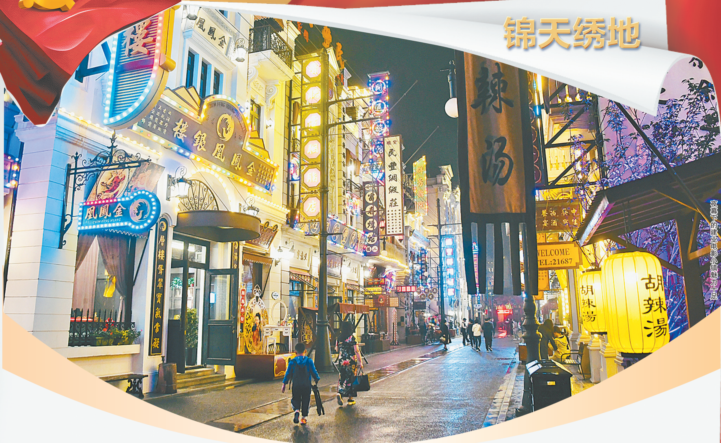
夜幕下的建业电影小镇魅力十足