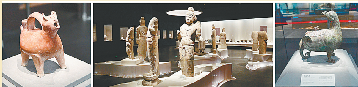
沿黄九省(区)文物精品展亮相郑州博物馆新馆

郑州，嵩山、黄河相伴于此，人文始祖、河洛古国相映生辉，我们有理由相信，这个来了都说“中”的地方，必将续写更加辉煌的文化篇章！