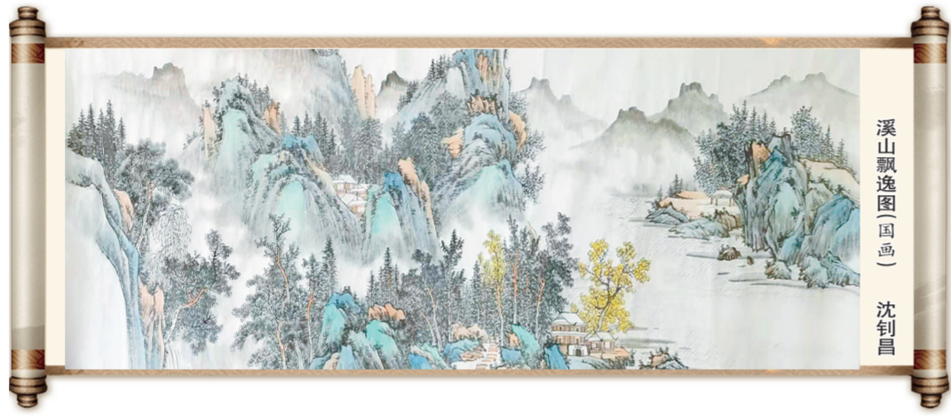
溪山飘逸图(国画) 沈利昌

人到绝境的时候，好像也有一种视死如归的大无畏精神，谁也不怕掉下去，只要能扒上车就行。求生欲望使人忘却了一切危险。又等了不知多长时间，火车才喘着粗气吭哧吭哧地开动了。由于严重超员，遇到上坡的路段，慢得和人走路的速度差不多，最难受的是钻山洞，人们都尽量低下头，头顶离洞顶不过一拃高，有的东西装得或高或宽一点，碰上洞顶或洞壁，呼呼啦啦，一大片人就摔到车下。煤烟呛得人睁不开眼出不来气，真是难受极了。潼关以东有一段路，日本人还不断从河北往河南打炮，过往的火车只能晚上偷偷地通行，小心翼翼地不能让人看见灯光听见响声，不然大炮便会呼啸而来，炸得车毁人亡，这是西行路上的一段生死关口，所以这种车当时叫作“闯关车”。过了潼关人们才可以喘一口气。火车走走停停，不知换了多少次车，走了多少天才到了西安。到西安后，住不起旅社，在北大城墙根下一处老乡的小土洞里住了几天。这些土洞长不到一丈，高不过五尺，都是河南逃荒的人挖的，阴潮湿，拥挤肮脏，一个挨着一个，像蜂巢一样，有的连洞也住不上，就用棍棍棒棒搭个架子，盖上席片杂草，支个窝棚栖身。至今西安北关自强路一带，80%以上是河南人，基本上都是这一时期逃难去的难民的后代。