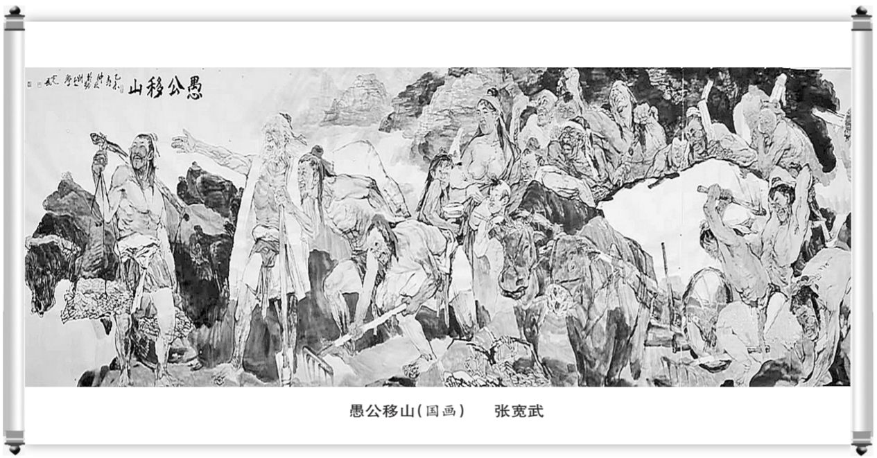
愚公移山(国画) 张宽武

可是冷热交战,云锋相迫,化风生雨,实为天地调剂旱涝,中和炎凉,以利于滋养生命万类。炎夏云生雨落最为寻常,所以夏花极妍极丽,瓜果品类繁多,夏天兼具春之妩媚与秋之丰饶,成为草木最